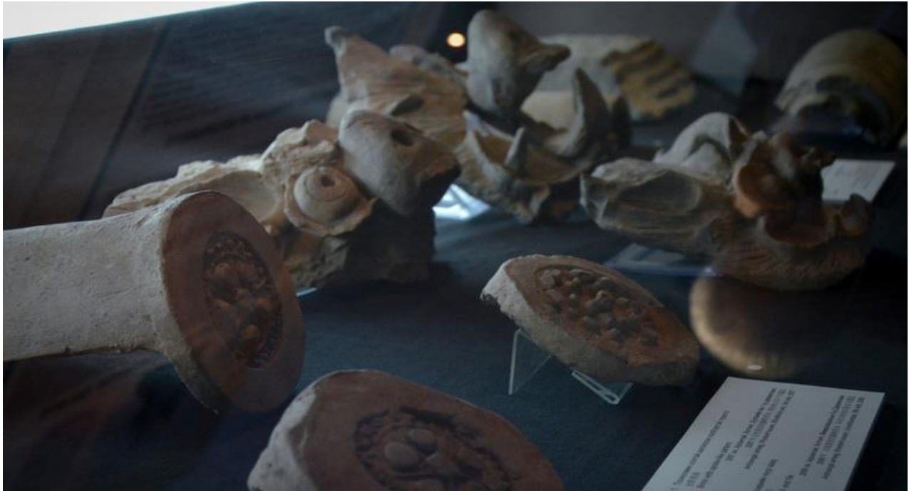
Зураг 6. Өвөрхавцалын амны 6 дугаар дөрвөлжингийн малтлагаас илэрсэн барилгын шавар чимэглэлүүд.

Уг олдвор нь Түрэгийн үеийн барилгын чимэглэл болоод Хятадын Тан улсын чимэглэлүүдээс өвөрмөц ялгаатай ажээ. Энэ чимэглэлийг сүм дугана, барилгын багана, дээврийн уулзвар хэсэгт байршуулдаг байсан бололтой.