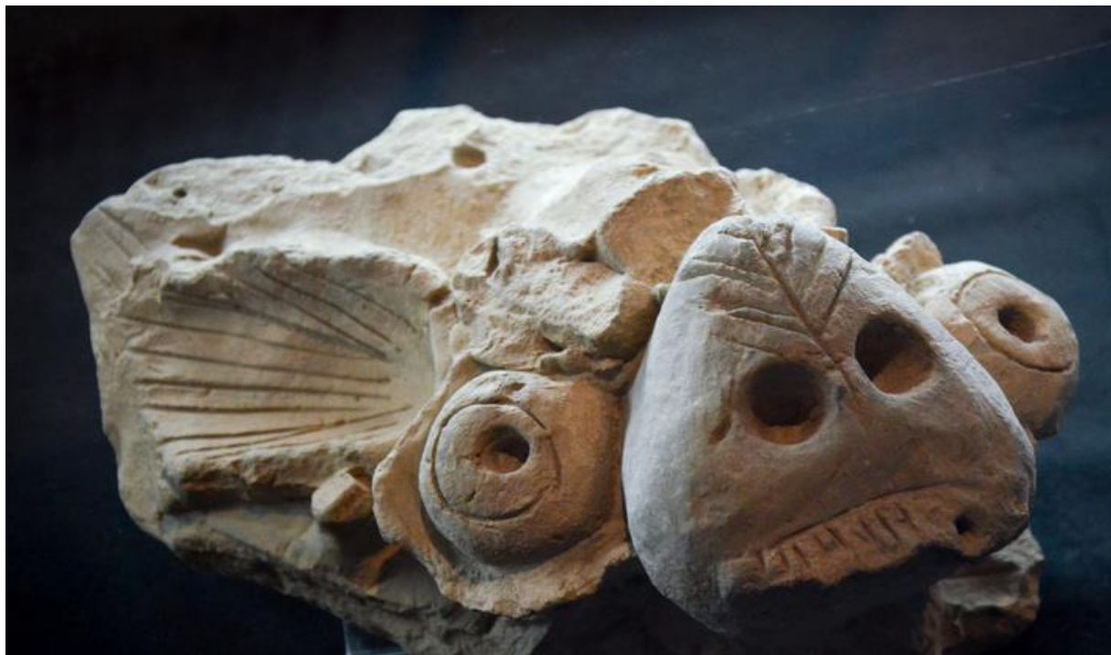
Зураг 7. Өвөрхавцалын амны 6 дугаар дөрвөлжингийн малтлагаас илэрсэн сүм дугана, барилгын багана, дээвэрт байрлуулдаг чимэглэл(хажуу талаас).