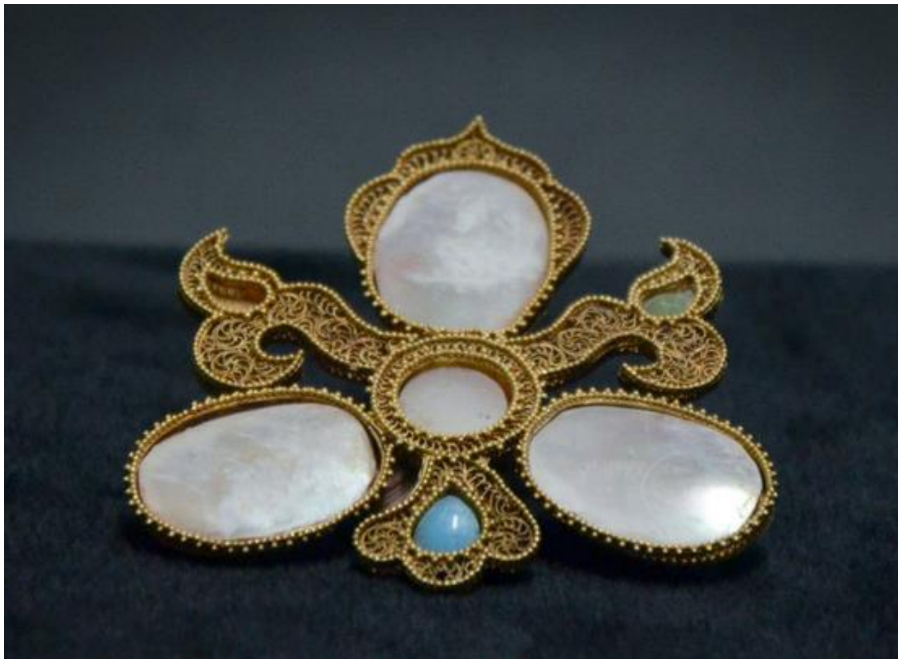
Зураг 5. Алтаар маш нарийн хийцтэй хийсэн “ЦОХ” хэмээх чимэглэл (ойролцоох булшнаас).