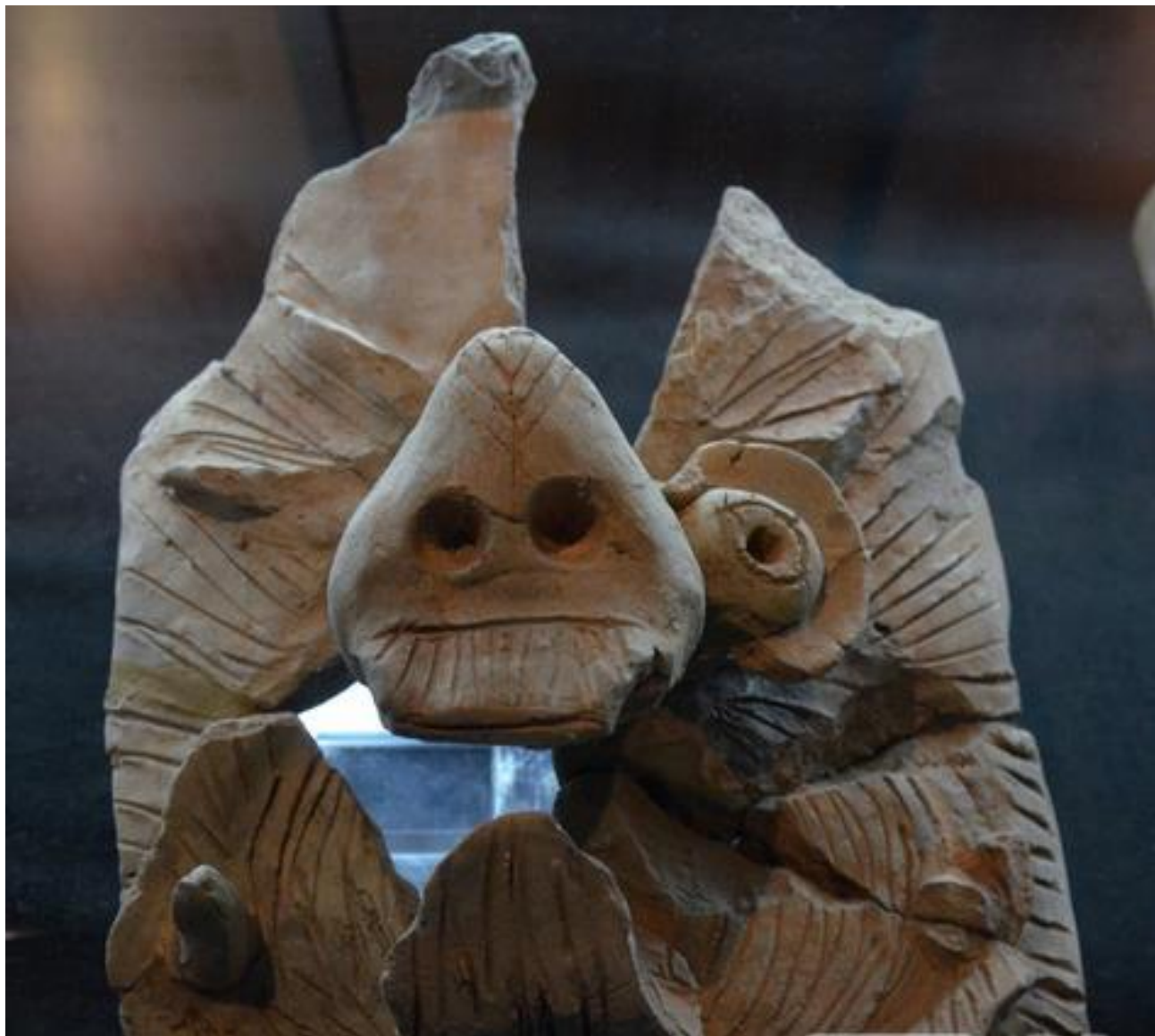
Зураг 8. Өвөрхавцалын амны 6 дугаар дөрвөлжингийн малтлагаас илэрсэн сүм дугана, барилгын багана, дээвэрт байрлуулдаг чимэглэл(ээц урд талаас).