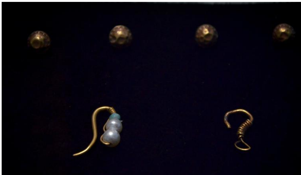
Зураг 3. Хоёр төрлийн алтан ээмэг, алтан товч ойролцоох бушинаас илэрсэн.