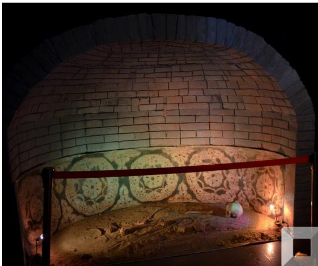
Зураг 1. Хундын хоолойн 5 дугаар дөрвөлжингийн бунханы ханан дахь бадам цэцэгэн хээ.

Зургийн үндсэн сэдэв нь цэцэг, ургамлын дүрст хээ бөгөөд улаан хүрэн, цагаан, хар өнгийн будгаар бадам цэцгийг олон давтамжтайгаар дурсэлжээ. Бадам цэцэг нь дорнын ард түмний дунд амар амгалангийн бэлгэдэл болдог. Тухайн зураг өнгө будгийн зохицол, дүрслэлийг харвал ихээхэн ур чадвартай үйлдсэн болох нь ажиглагдана. Уг зураг нь тухайн үеийн дүрслэх урлаг, уран зургийн түвшинг харуулах биет дурсгал болж байна.